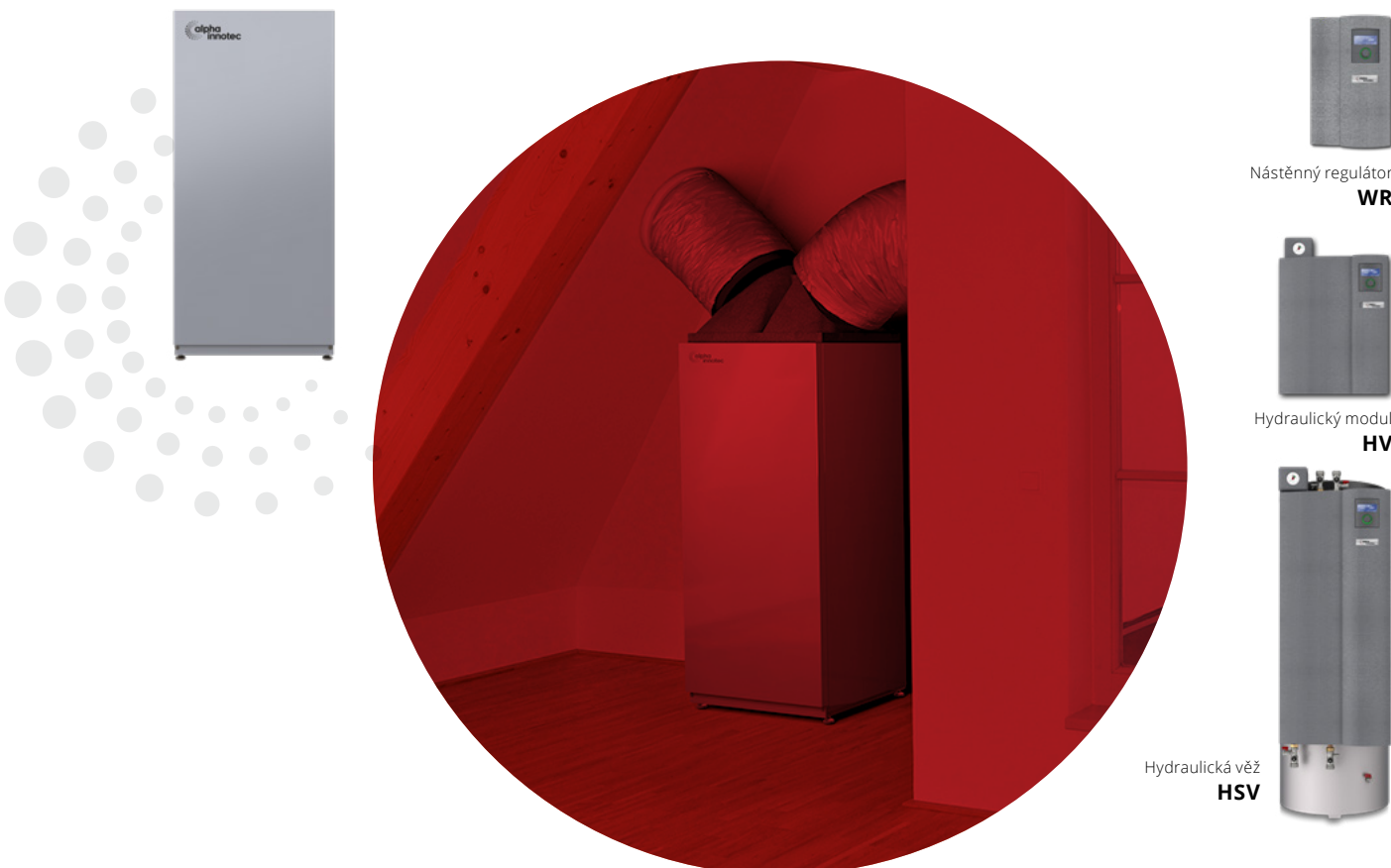
Nástěnný regulátor WR

*údaje při A2/W35 podle EN 14511, **cena neobsahuje instalační materiál, práci a příslušenství.